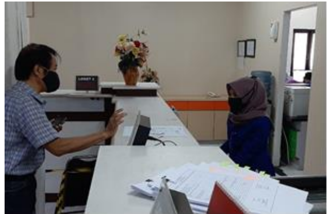
Pelayanan Loker Costumer Services

Jumlah Permohonan Perizinan Yang Masuk Sebanyak 91 Berkas