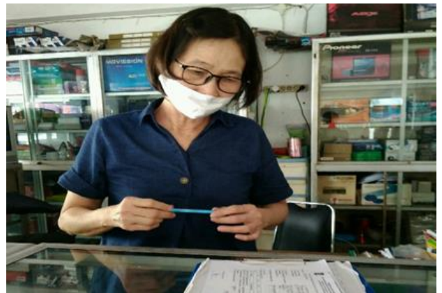
CV Lautan Emas Oentoeng Jl. Darmo Park II Blok III No. 14