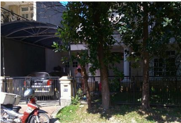
UD. Berharga Karunia Villa Bukit Mas D 11, Jl. Abdul Wahab Siamin Surabaya