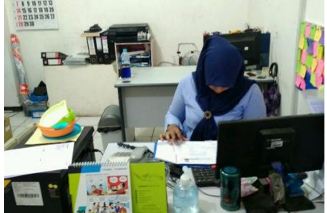
PT Aneka Cipta Total Solusindo Jl. Jemur Andayani 50, Ruko Surya Inti Permata Blok F 3-5