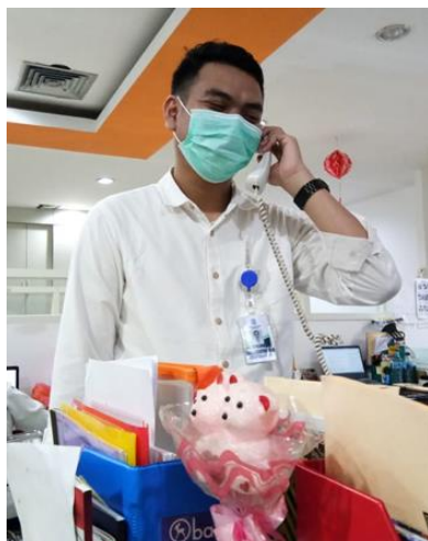
PT Bintang Karya Steel