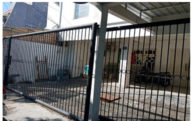
Jl. Wonosari Kidul No. 9