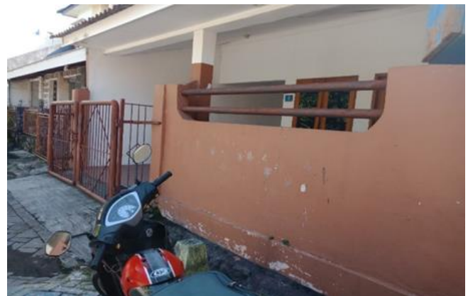
Jl. Wonoboyo I No. 6