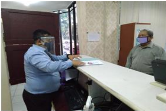
Pelayanan Konsultasi Dinas Kesehatan