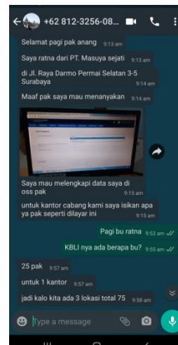
PT Masuya Sejati (Papaya)

Jumlah Perusahaan yang Diberikan Pengawasan Sebanyak 4 Perusahaan