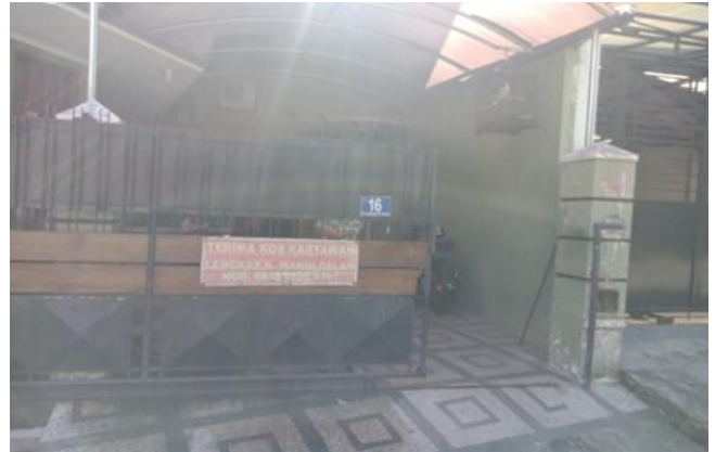
Jl. Wonoboyo I No. 16