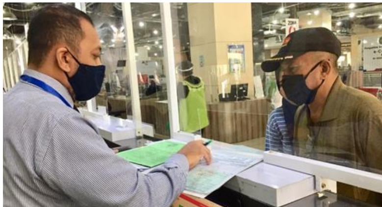
Pelayanan Loker Customer Services

Jumlah Permohonan Perizinan Yang Masuk Sebanyak 74 Berkas