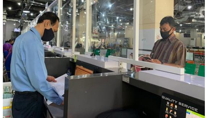
Pelayanan Loker Pengambilan