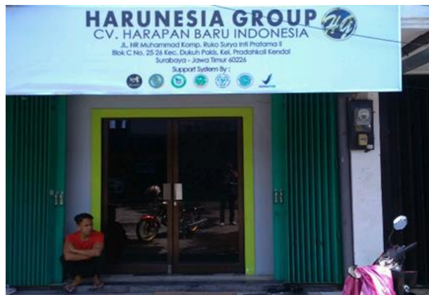
CV Harapan Baru Indonesia Komplek Ruko Surya Inti Pratama II Blok C No. 25 - 26