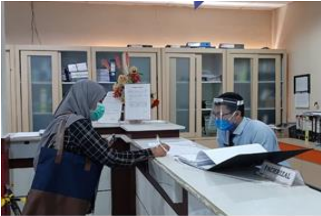
Pelayanan Loker Pengambilan