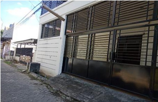
Jl. Wonoboyo I No. 20