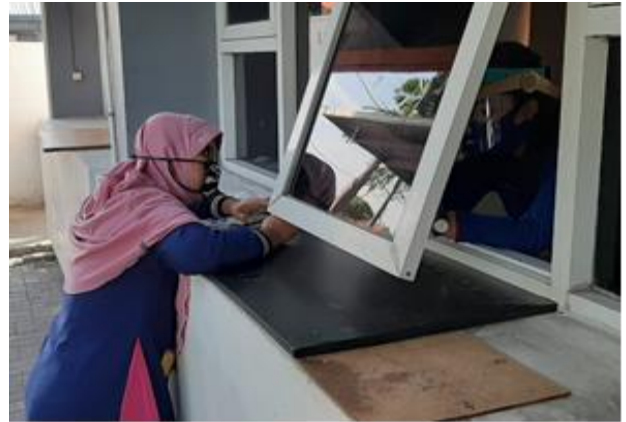
Pelayanan Loker Informasi