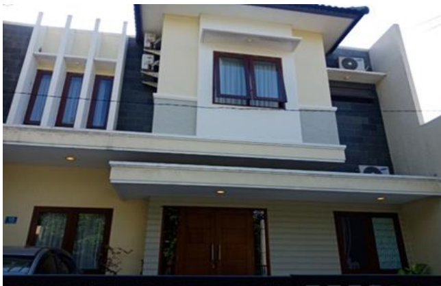
Jl. Wonoboyo I No. 10