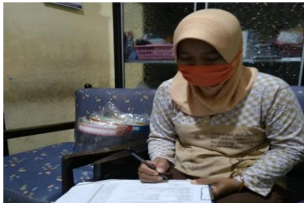
An Nur Dukuh Kalikendal II Gang Melati