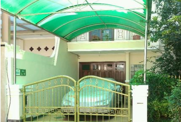
UD Tunas Mulia Jl. Bukit Pakis Timur 4 / L-9