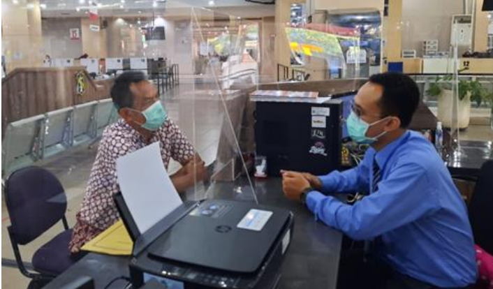
Pelayanan Loker Informasi